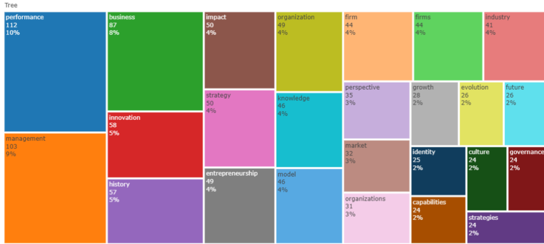
Şekil 2. Kelime Ağacı

Şekil 2'deki kelime ağacı analizinde görüleceği üzere en yüksek skora sahip yirmi beş anahtar kelime paylaşılmıştır. Buna göre; İşletmecilik Tarihi çalışmalarında ağırlık performans kavramına verilmiştir. Bunu; yönetim, işletme, inovasyon, tarih, etki, strateji, girişimcilik, örgüt, bilgi, model, firma, perspektif, pazar, firmalar, büyüme, kimlik, kapasite, sanayi, evrim, kültür, gelecek ve yönetim kavramları izlemektedir.